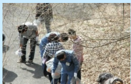
三春ダム周辺コース

清掃活動終了後は、希望者にはダム見学会が催され、参加者は日頃見ることができないダムの内部を見て回ったり、ダムの仕組みや役割の説明を聞いて三春ダムについて理解を深めました。