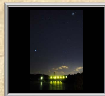
「冬の星座と春田大橋」渡辺 勝