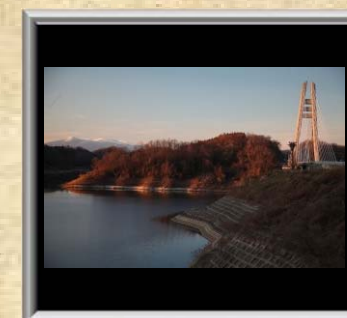
「さくら湖の遠景」渡辺 公文