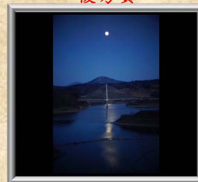
「さくら湖を照らす月」近藤 広章