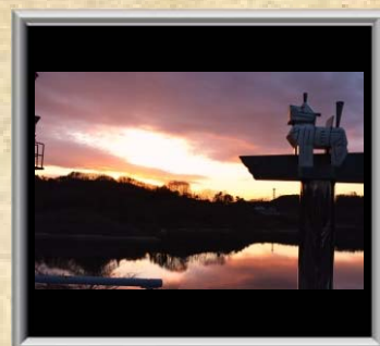
「まほらの夕焼」望月 治