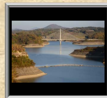
「秋のさくら湖」小田島 守明