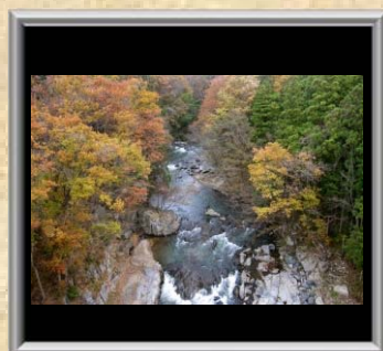
「秋の峡谷」小林 宏一