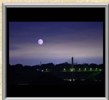
「春田大橋」小野 勝人