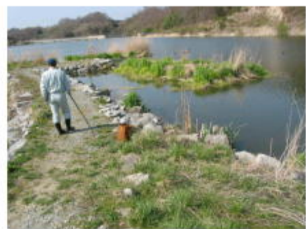
点検状況(蛇石前ダム上流)

今回の点検では、重大な危険は認められませんでした。通常の見回り等でも異常が認められた場合は、必要に応じて立入禁止措置や危険の周知に努めていきます。