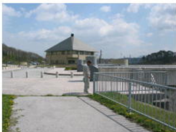
点検状況(堤体周辺)

今年もゴールデンウィーク前の点検を、4月16日（金）に管理所職員と三春町職員で分担して行いました。