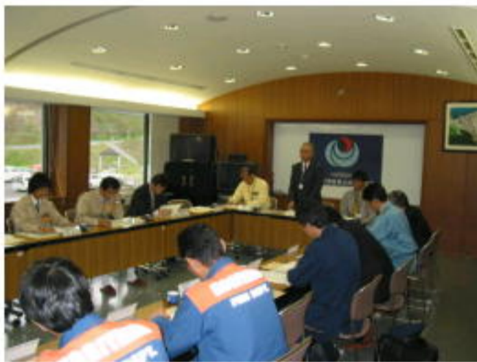
放流通報連絡会の様子

4月23日（金）に、三春ダム利水者事業説明会及び三春ダム放流通報連絡会を開催しました。