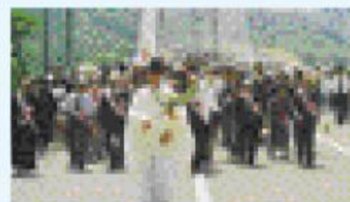
春田大橋開通式 三世代夫婦による渡り初め