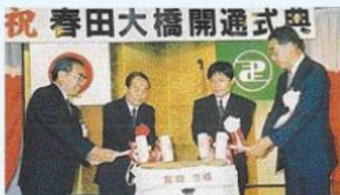
春田大橋開通式典 春田大橋開通式鏡割り